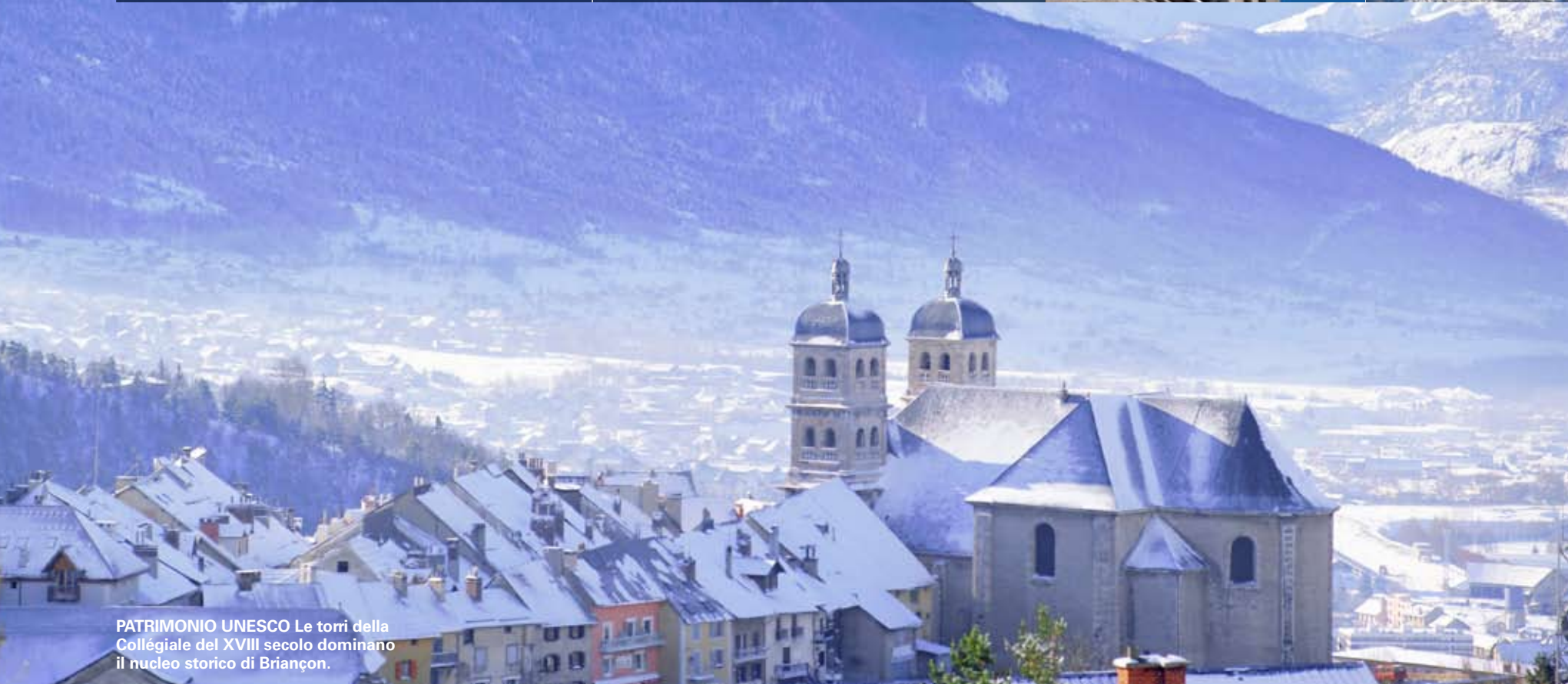
PATRIMONIO UNESCO Le torri della Collégiale del XVIII secolo dominano il nucleo storico di Briançon.